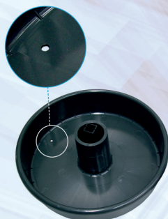
Fig. 1 Corpo portamatassa con foro per fermo matassa Hole for coil stop