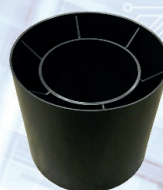
Fig. 2 Adattatore-distanziale Adapter